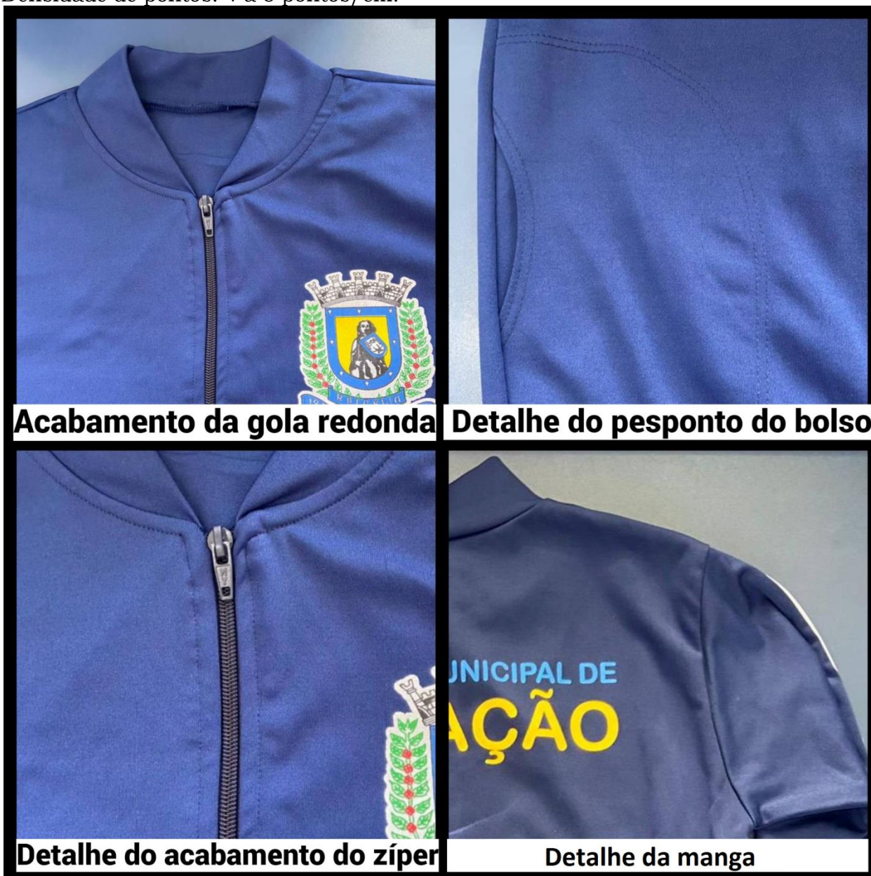
Acabamento da gola redonda