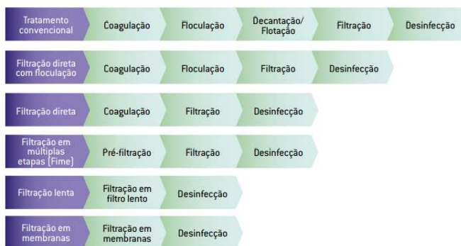
Figura 2 – Técnicas mais usuais de tratamento de água para abastecimento público